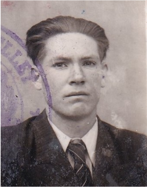
MRN Champigny-sur-Marne, fonds Eysses